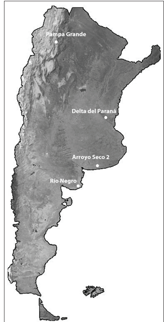
Fig. 1. Ubicación de las áreas de procedencia de las series analizadas.

Las series analizadas del MLP se escogieron por ser las más extensas y las que mayor información odontométrica permitían extraer (series con denticiones más completas y con mejor estado de conservación de las piezas dentarias). También destaca en estas series que en ningún caso se las asocia con lo que Pucciarelli (2004) denomina