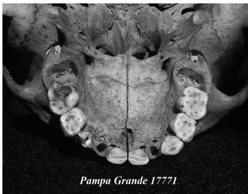
Fig. 2. Cráneo de la serie Pampa Grande que muestra evidencias de pérdida de piezas dentarias por procesos tafonómicos.

En relación a las variables analizadas, entendemos por diámetro mesio-distal (MD) a la distancia máxima que separa los puntos de contacto de un diente con sus vecinos en senti-